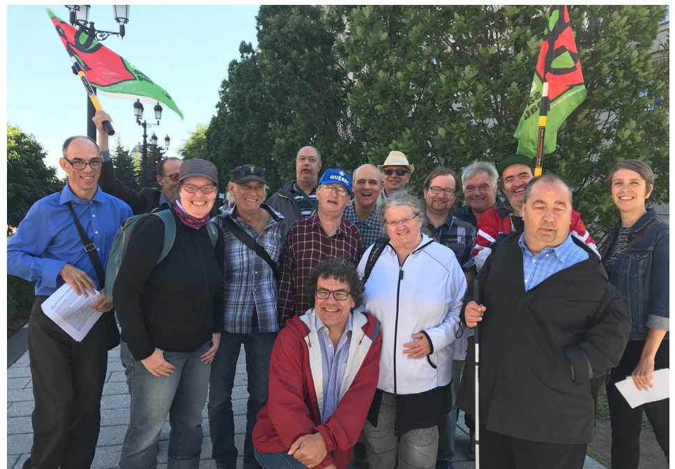
Les participantEs au point de presse du 7 septembre devant les bureaux du premier ministre.