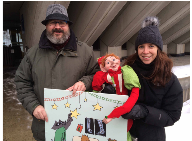
Les trois porte-parole

Peut-être que renards, oies, lapins, ours et marmottes parviendront à faire entendre le message que les mouvements sociaux s'évertuent à répéter depuis des années... Qui sait?!