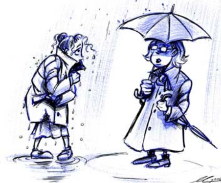
Illustration de David Lemelin