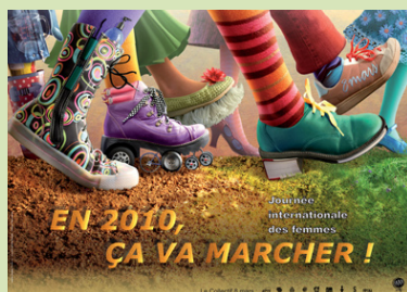
Huguette Latulippe/Promotion inc. Illustration: Geneviève Guénette